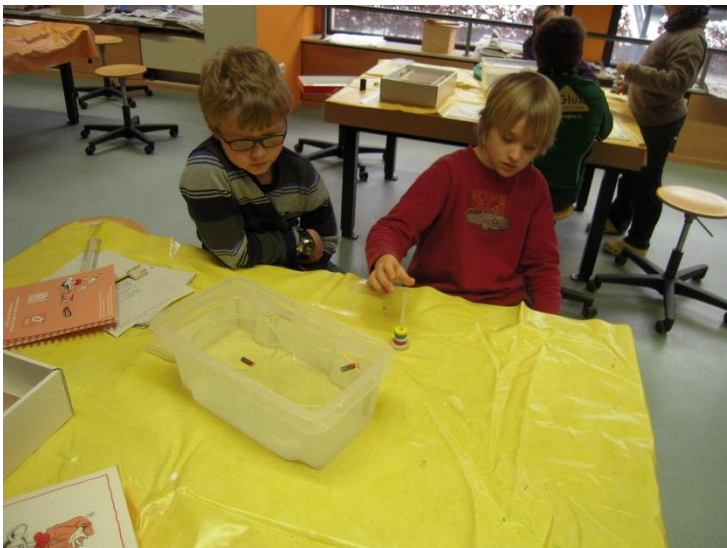
Verschiedene Pole ziehen sich an. Gleiche Pole stoßen sich ab.