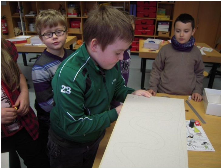
Der Magnet zieht auch durch den Karton an