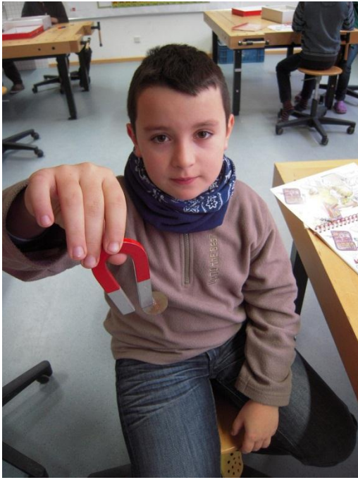
Magnete ziehen Objekte aus Eisen, Kobalt und Nickel an.