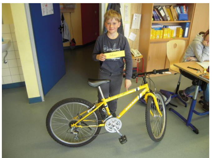
Nach der Theorie die Praxis