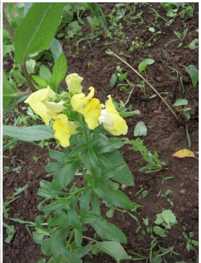
Die ersten Blumen beginnen zu blühen