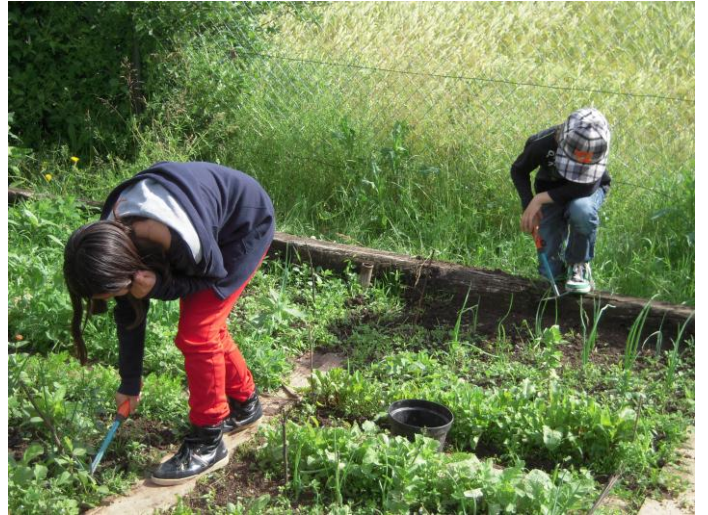
Jäten und jäten und .....